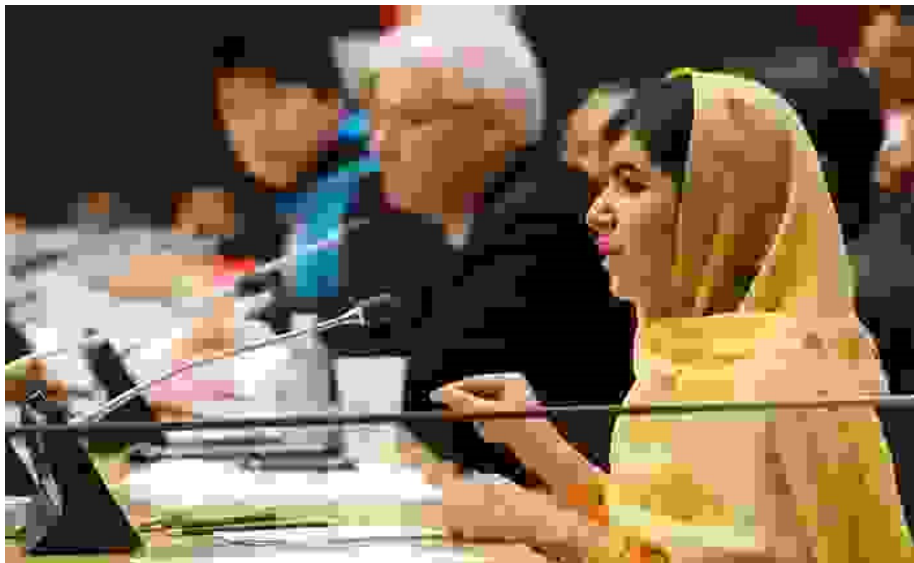
Die Kinderrechtsaktivistin Malala sprach als 16-Jährige vor den Vereinten Nationen in New York.

d) kann der Ausschuss aufgrund der Angaben, die er nach den Artikeln 44 und 45 erhalten hat, Vorschläge und allgemeine Empfehlungen unterbreiten. Diese Vorschläge und allgemeinen Empfehlungen werden den betroffenen Vertragsstaaten übermittelt und der Generalversammlung zusammen mit etwaigen Bemerkungen der Vertragsstaaten vorgelegt.