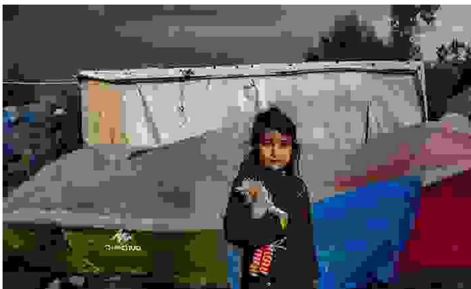
Jedes Kind hat das Recht auf angemessene Lebensumstände.

(4) Die Vertragsstaaten treffen alle geeigneten Maßnahmen, um die Geltendmachung von Unterhaltsansprüchen des Kindes gegenüber den Eltern oder anderen finanziell für das Kind verantwortlichen Personen sowohl innerhalb des Vertragsstaats als auch im Ausland sicherzustellen. Insbesondere fördern die Vertragsstaaten, wenn die für das Kind finanziell verantwortliche Person in einem anderen Staat lebt als das Kind, den Beitritt zu internationalen Übereinkünften oder den Abschluss solcher Übereinkünfte sowie andere geeignete Regelungen.