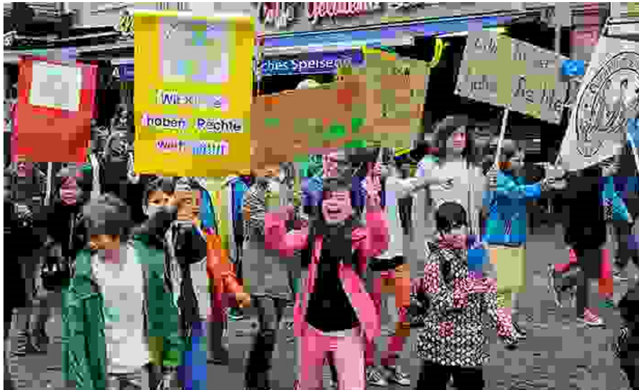
Kinder in Düsseldorf demonstrieren auf der Straße für Kinderrechte.