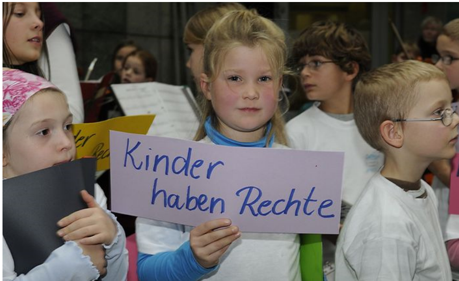
Gleiche Rechte für alle Kinder weltweit!

Die Vertragsstaaten treffen alle geeigneten Gesetzgebungs-, Verwaltungs- und sonstigen Maßnahmen zur Verwirklichung der in diesem Übereinkommen anerkannten Rechte. Hinsichtlich der wirtschaftlichen, sozialen und kulturellen Rechte treffen die Vertragsstaaten derartige Maßnahmen unter Ausschöpfung ihrer verfügbaren Mittel und erforderlichenfalls im Rahmen der internationalen Zusammenarbeit.